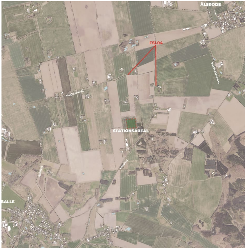
Figur 8-14 Fotostandpunkt fra FS1.04.