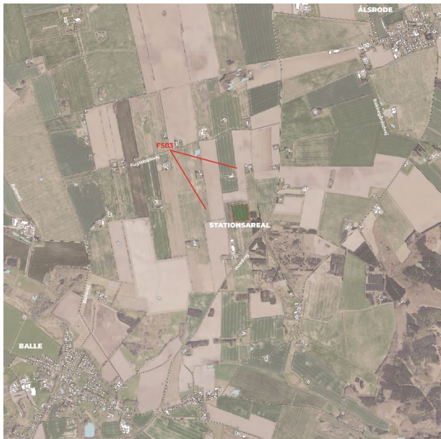
Figur 8-26 Fotostandpunkt fra FS03