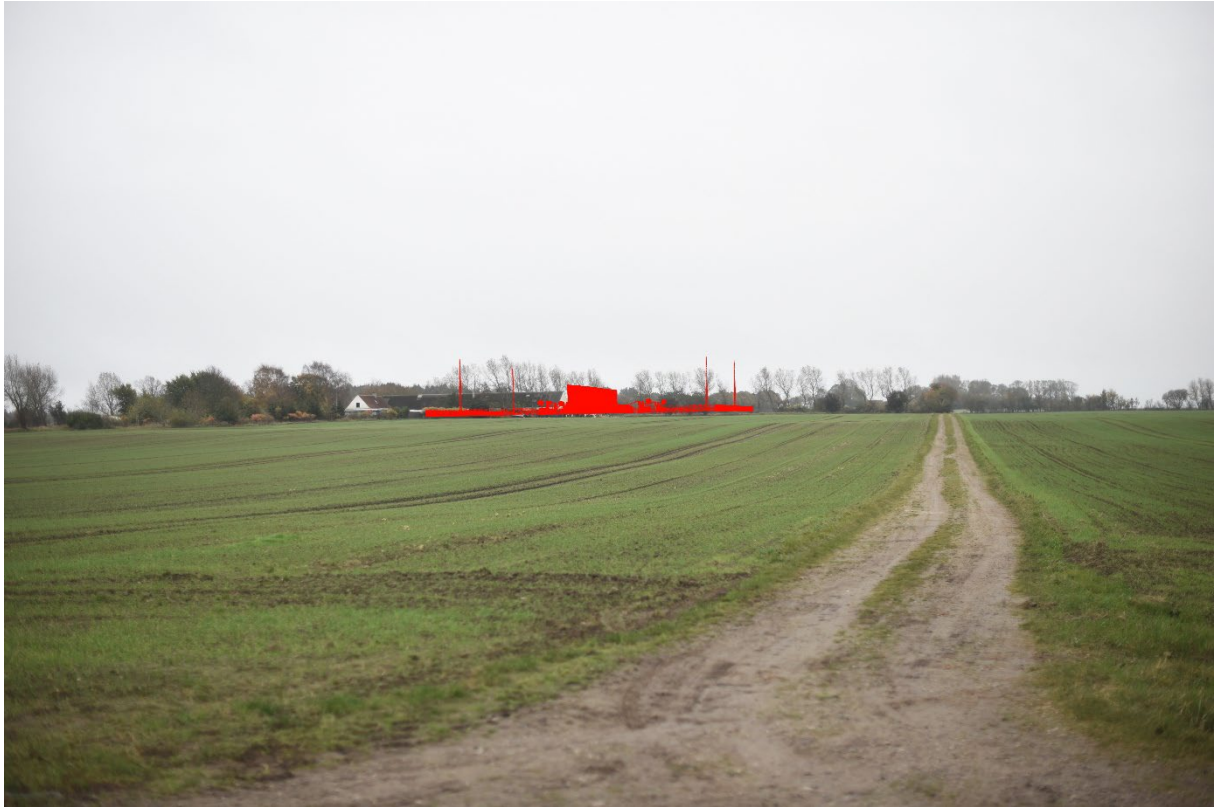
Figur 8-24 Visualisering fra FS03a - tekniske anlæg uden beplantning.