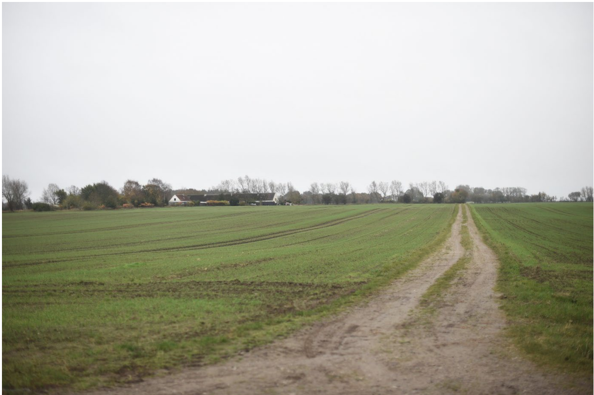
Figur 8-23 Eksisterende forhold fra fotostandpunkt FS03A