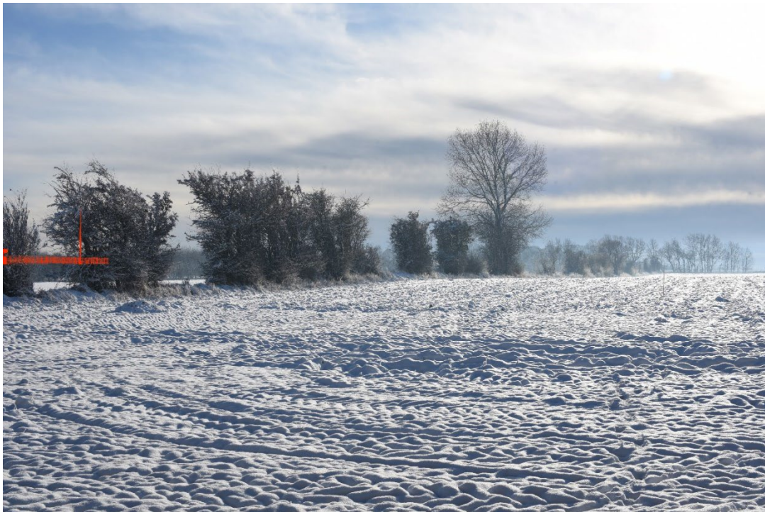
Figur 8-32 Visualisering fra FS1.05 - tekniske anlæg uden beplantning.