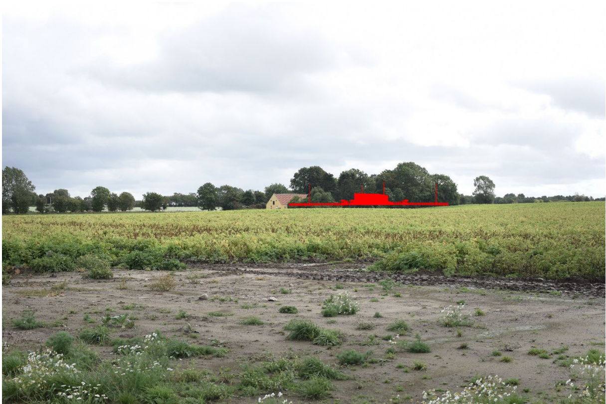
Figur 8-28 Visualisering fra FS03 - tekniske anlæg uden beplantning.