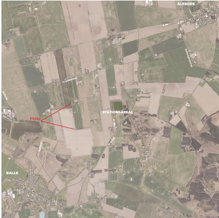
Figur 8-2 Fotostandpunkt for FS01a.