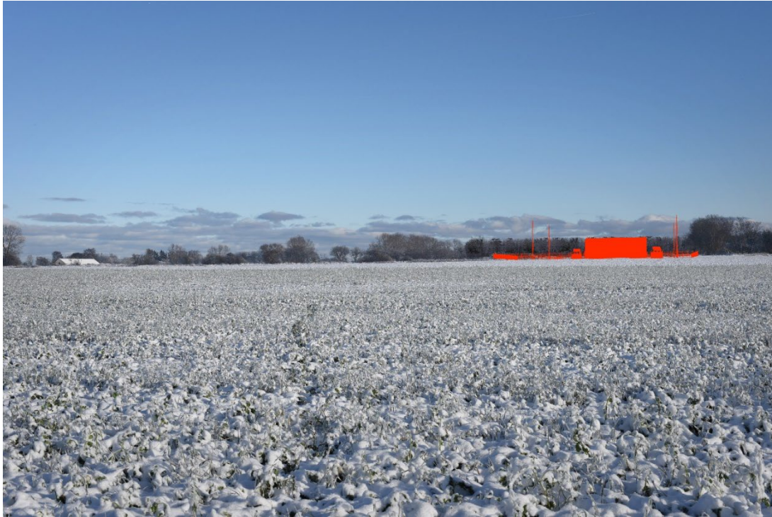
Figur 8-36 Visualisering fra FS1.06 - tekniske anlæg uden beplantning.