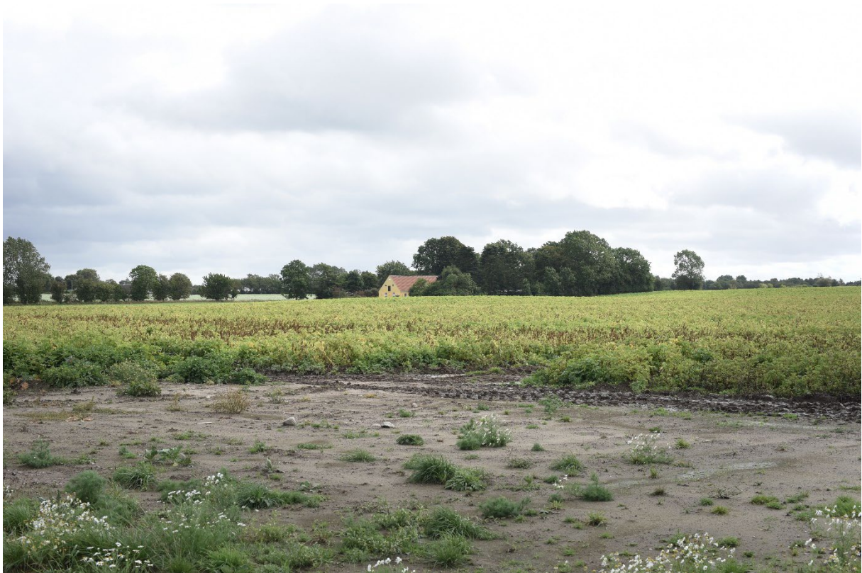
Figur 8-27 Eksisterende forhold fra fotostandpunkt FS03