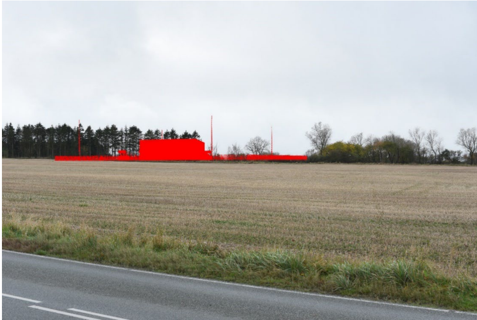
Figur 8-12 Visualisering fra FS1.02 - tekniske anlæg uden beplantning.