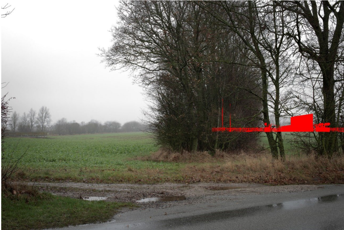
Figur 8-8 Visualisering fra fotostandpunkt FS1.01 uden beplantning.