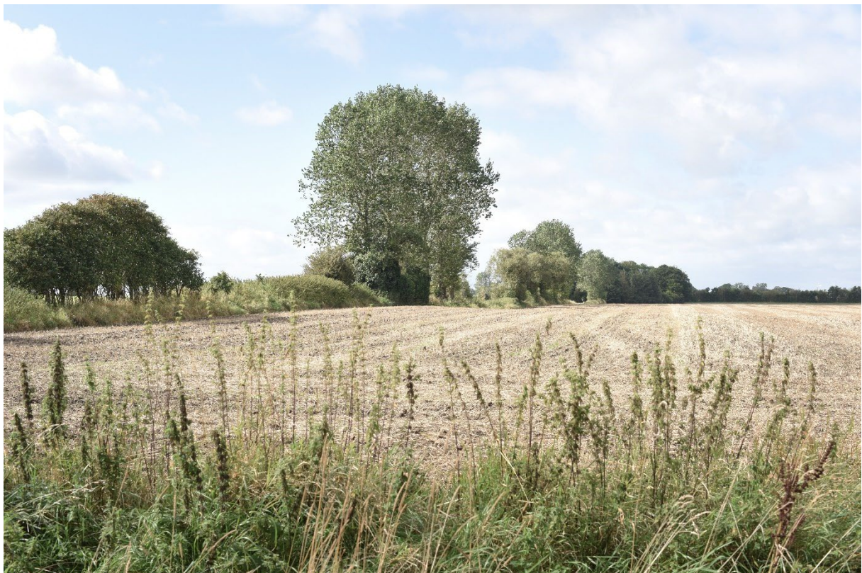
Figur 8-19 Eksisterende forhold fra fotostandpunkt FS05