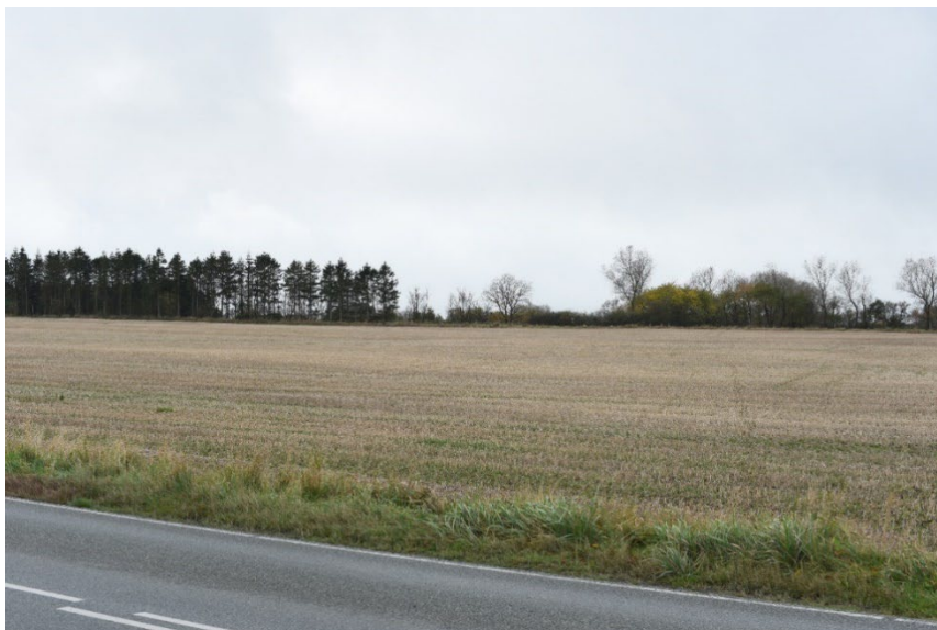
Figur 8-11 Eksisterende forhold fra fotostandpunkt FS1.02.