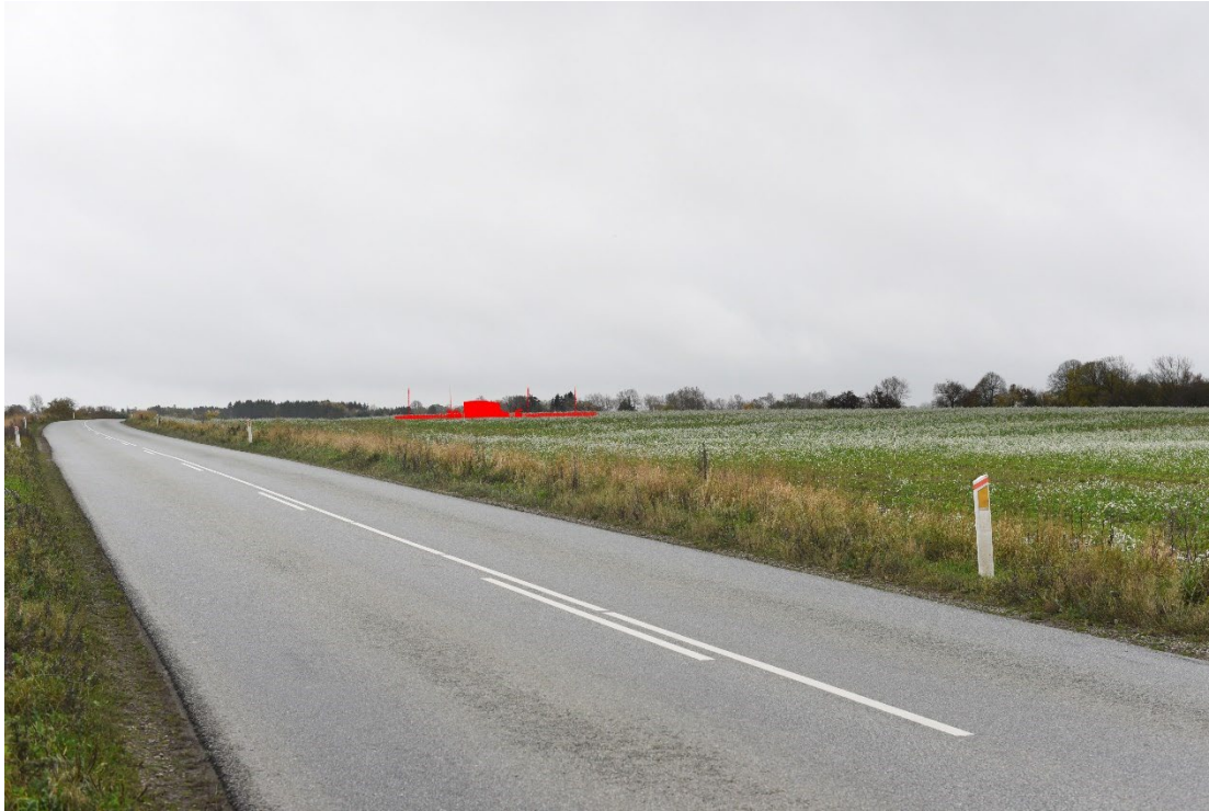
Figur 8-16 Visualisering fra FS1.04 - tekniske anlæg uden beplantning.