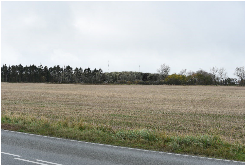
Figur 8-13 Visualisering fra FS1.02 - tekniske anlæg med beplantning.