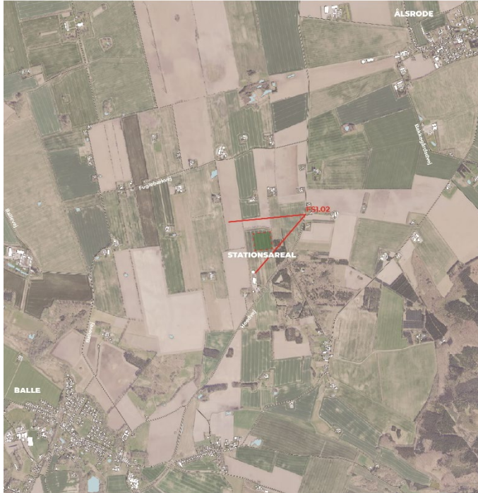
Figur 8-10 Fotostandpunkt fra FS1.02.