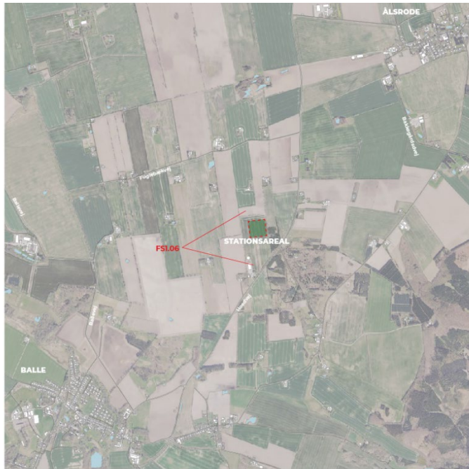
Figur 8-34 Fotostandpunkt fra FS1.06