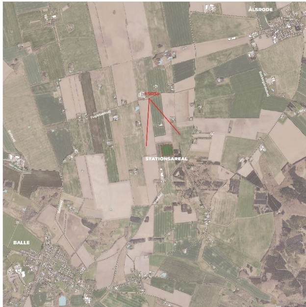
Figur 8-22 Fotostandpunkt fra FS03A