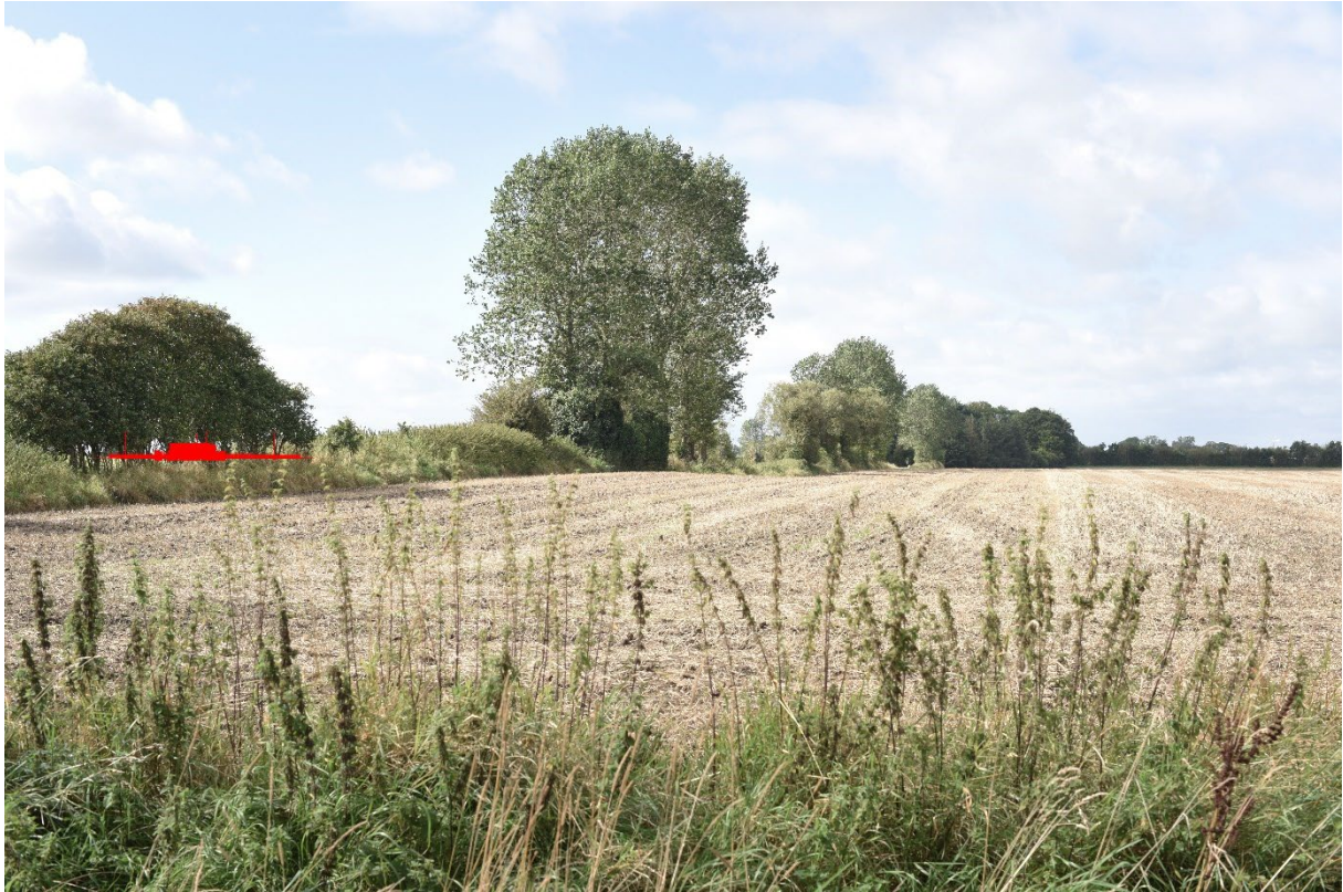
Figur 8-20 Visualisering fra FS05 - tekniske anlæg uden beplantning.