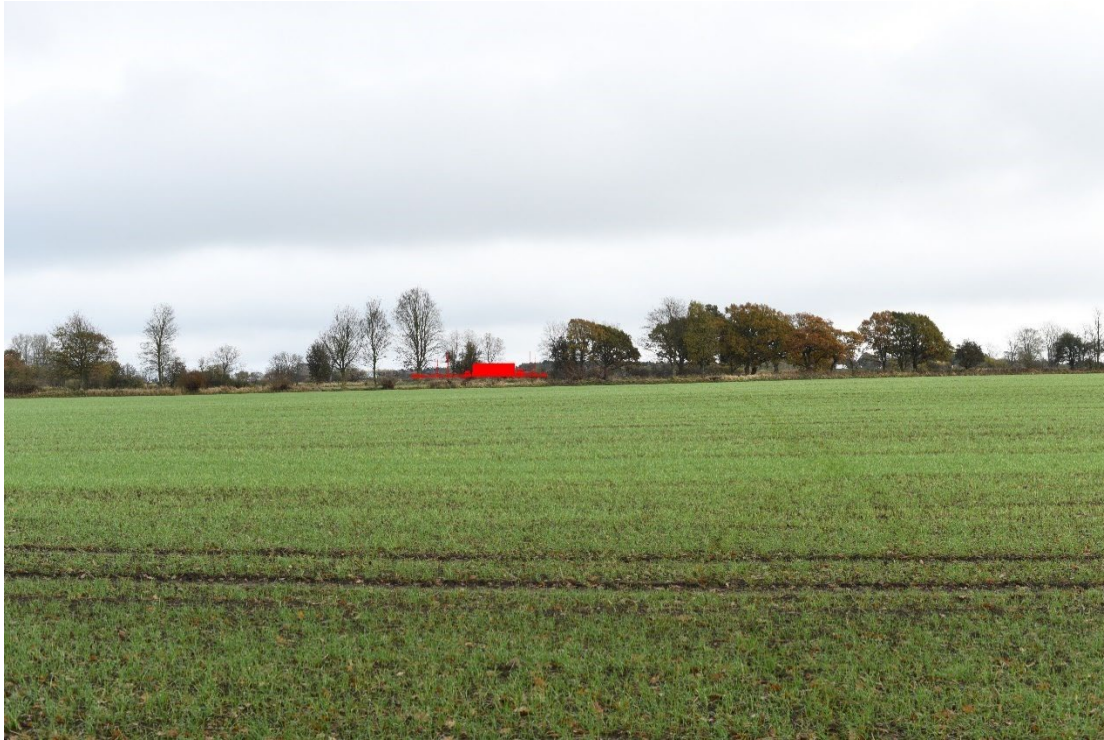
Figur 8-4 Visualisering fra fotostandpunkt FS01a.