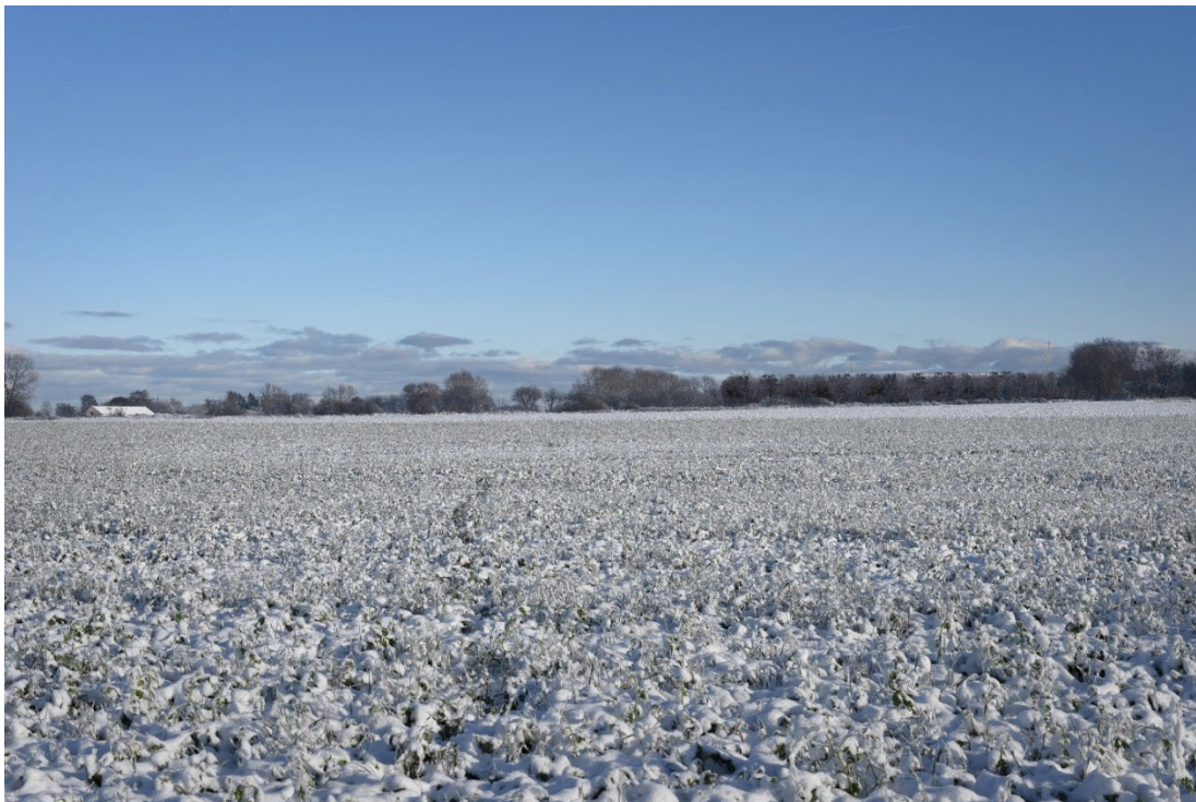
Figur 8-37 Visualisering fra FS1.06 - tekniske anlæg med beplantning.