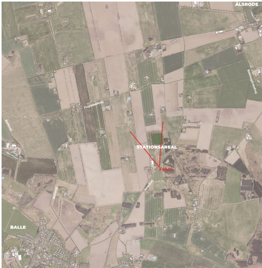
Figur 8-6 Fotostandpunkt FS1.01.