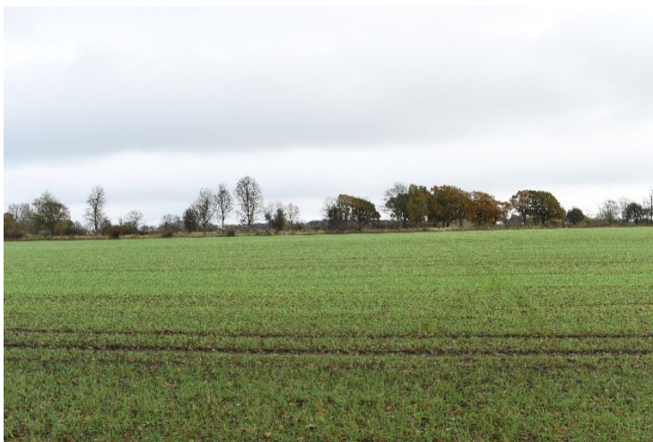
Figur 8-3 Eksisterende forhold fra fotostandpunkt FS01a.