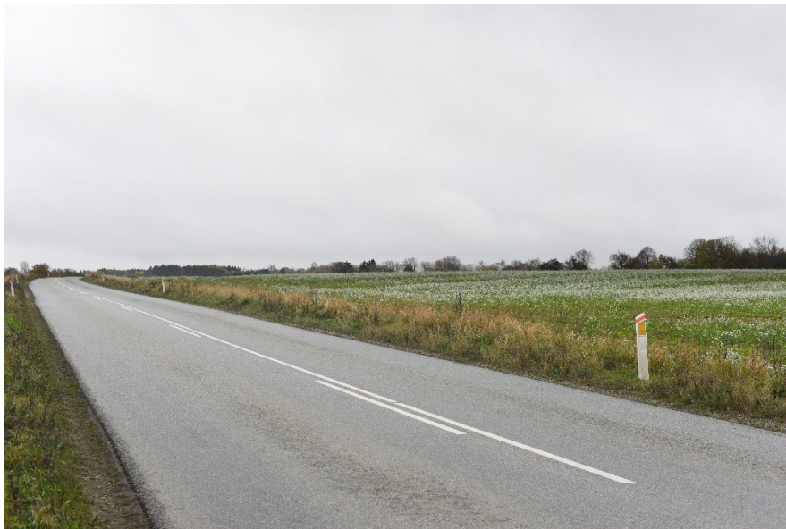
Figur 8-15 Eksisterende forhold fra fotostandpunkt FS1.04.