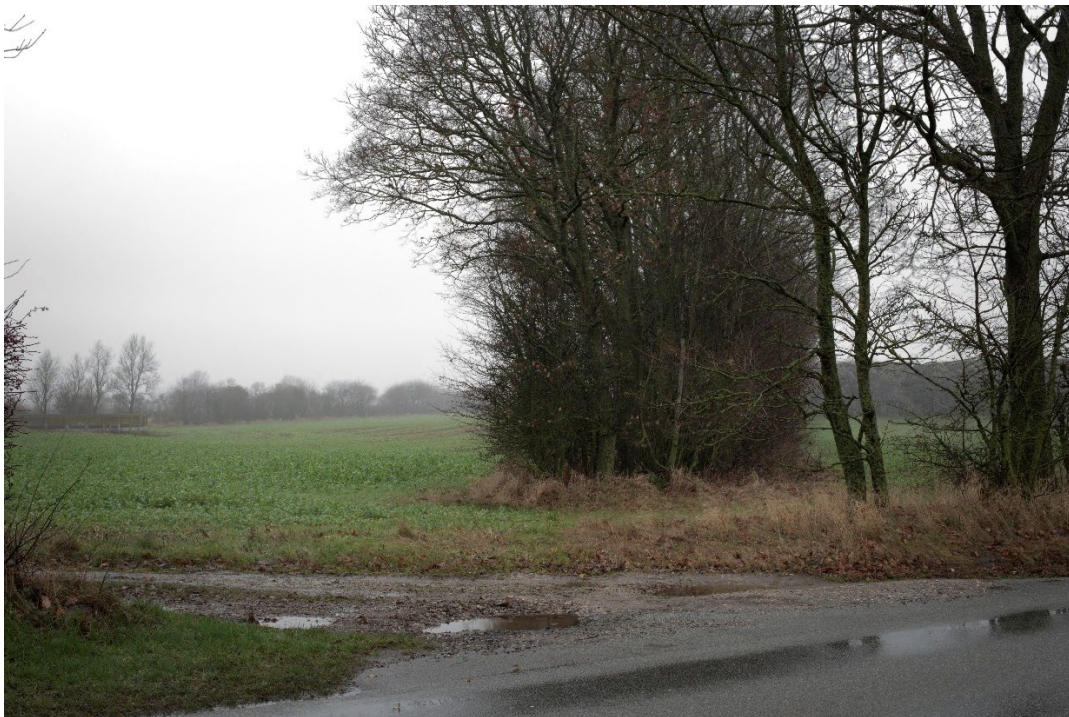
Figur 8-9 Visualisering fra fotostandpunkt FS1.01 med beplantning.